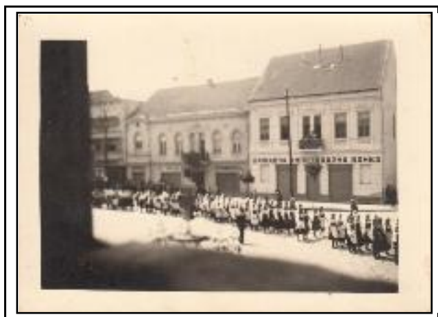
Једна прослава у Јагодини 1942. године