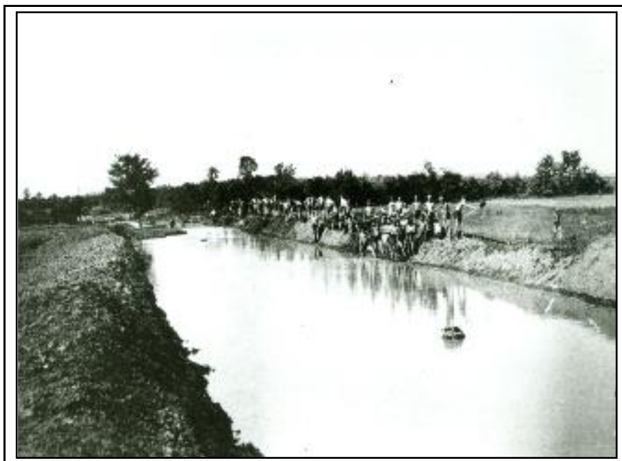
Са акције око уређења корита Белице током 1942. године