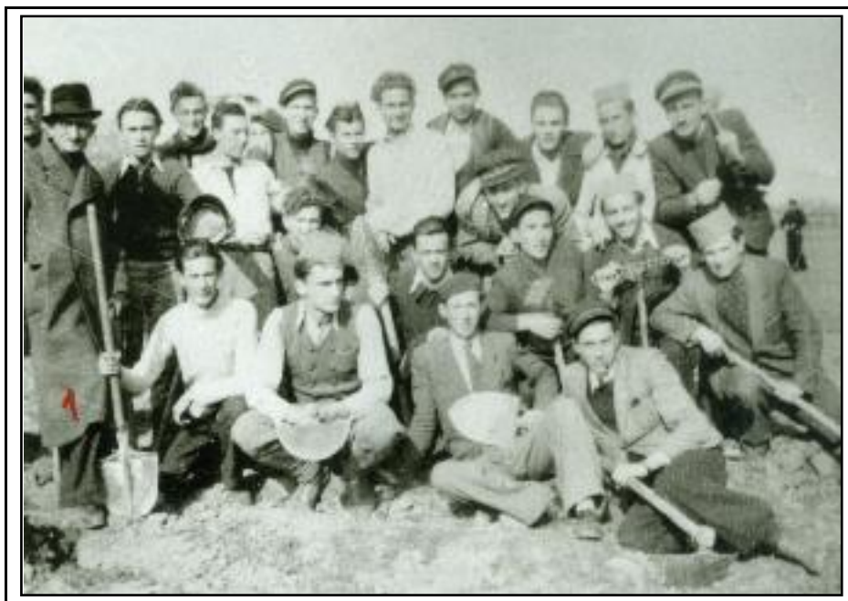
Група ученика Гимназије на уређењу корита Белице