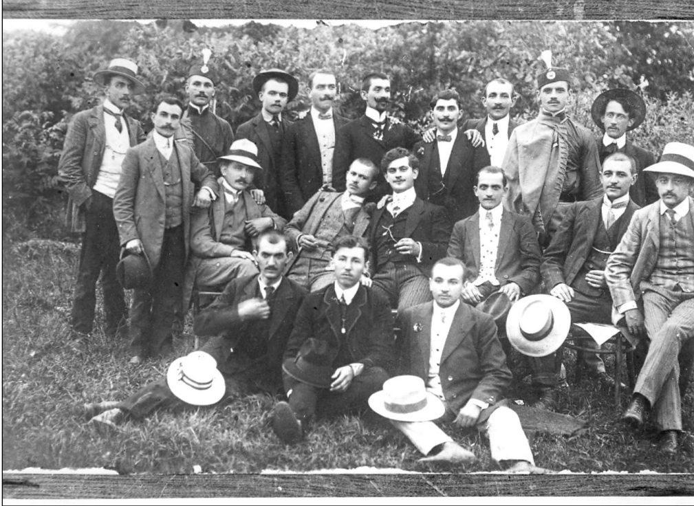
Јагодински радикални подмладак – Група млађих чланова Радикалне странке у Јагодини, снимак од 11. августа 1911. године