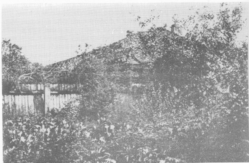
Кућа Јеврема и Свећозара Марковића у Јагодини (снимак Емила Цвејића с' њочейка XX века)