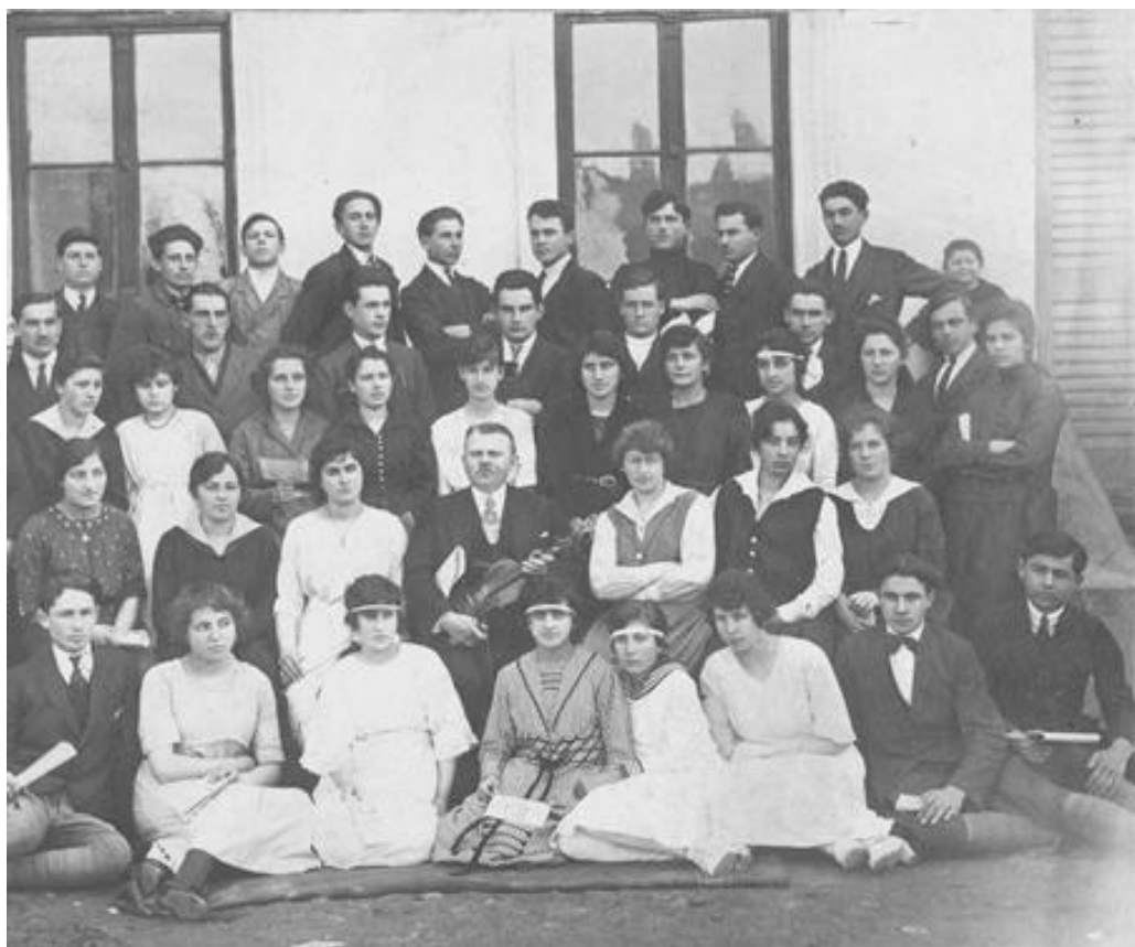
Светсавски хор гимназије 1913. године

Узроци слабијег успеха из појединих предмета, били су углавном као и ранијих година: 1. Кашњење са распоредом наставника, 2. Поједине предмете предавали су нестручни наставници, 3. Велики број ученика у појединим разредима, 4. Неупотребљивост неких наставника, 5. Нерад код неких ученика због нередовног стања у школи, 6. Неспремност ученика из основне школе, 7. Недовољност у училима (готово да није било соба за кабинете), гимнастика се зими није обављала ван учионица, учионице су неуредне и нехигијенске, 8. Оптерећеност разредних старешина часовима и великом администрацијом.