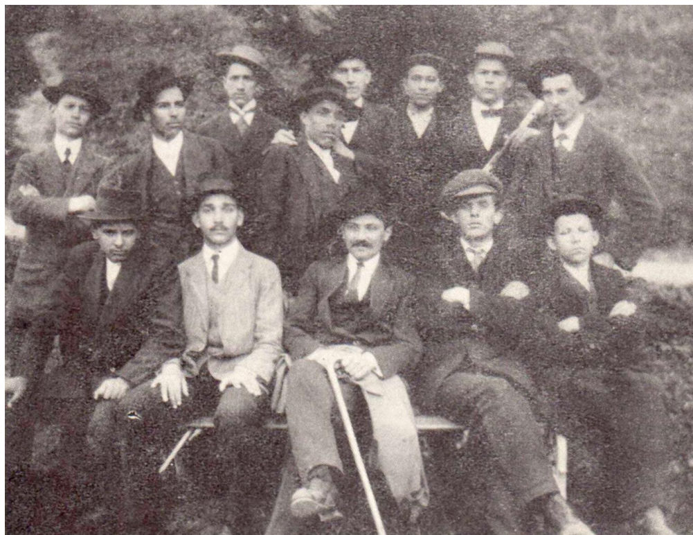
Ученици VI разреда 1913-1914. године са разредним старешином