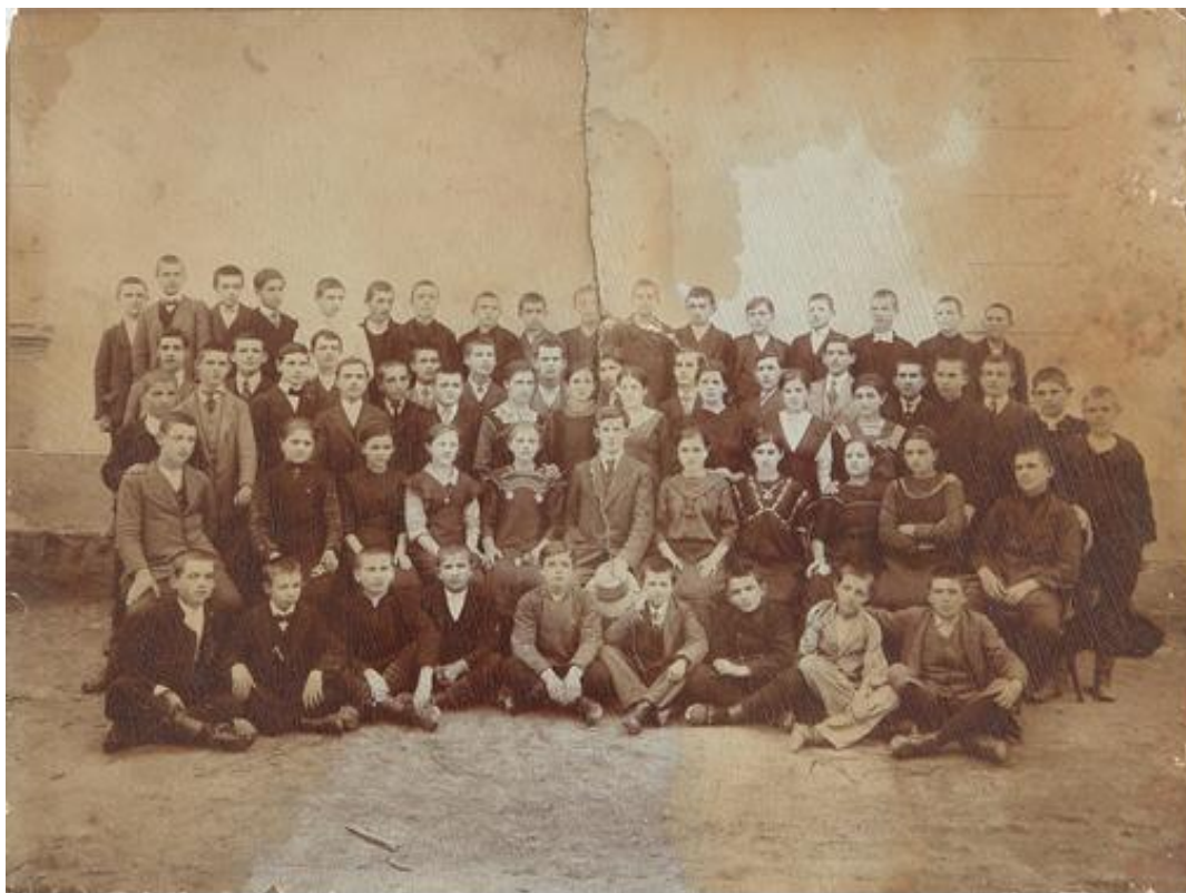
Четврти разред гимназије 1913. године

Школска 1913-1914. година отпочела је са закашњењем због колере, која је владала у Јагодини и околини. 117