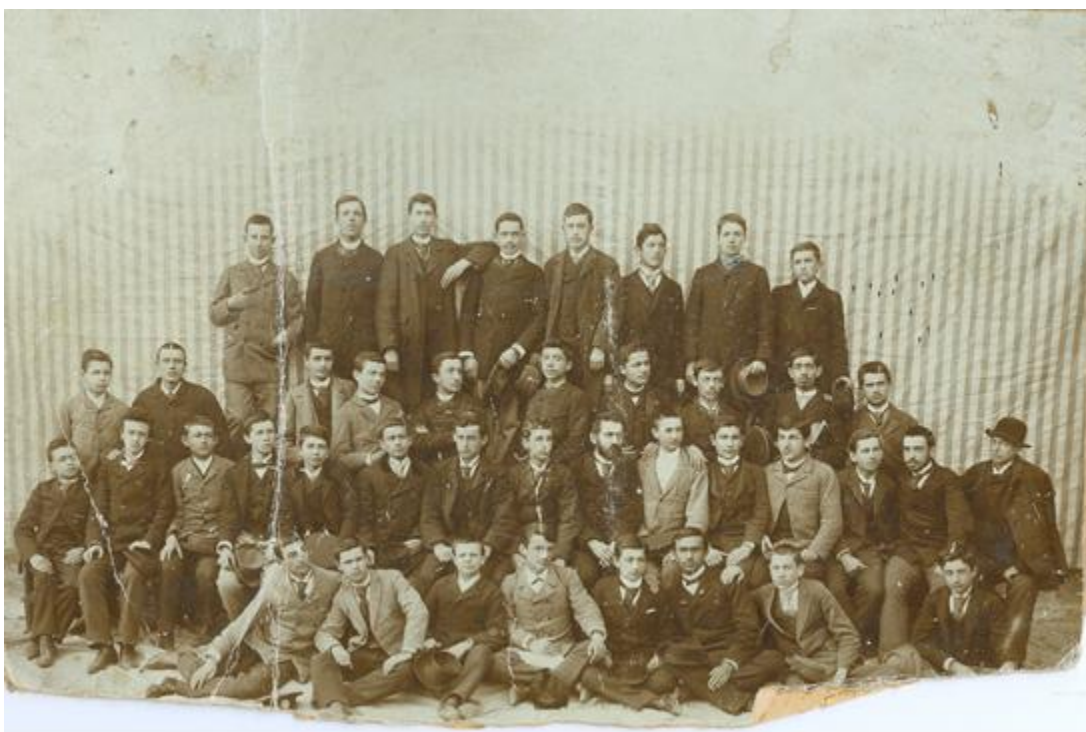
Ученици Ниже гимназије 1886-1891. године

Рад у новој школској години отпочет је 19. августа 1899. године, по извршеном пријемном испиту и упису ђака. На пријемном испиту јавило се 29 ученика, и то 11 из места, а 18 из околине. Сви су примљени.