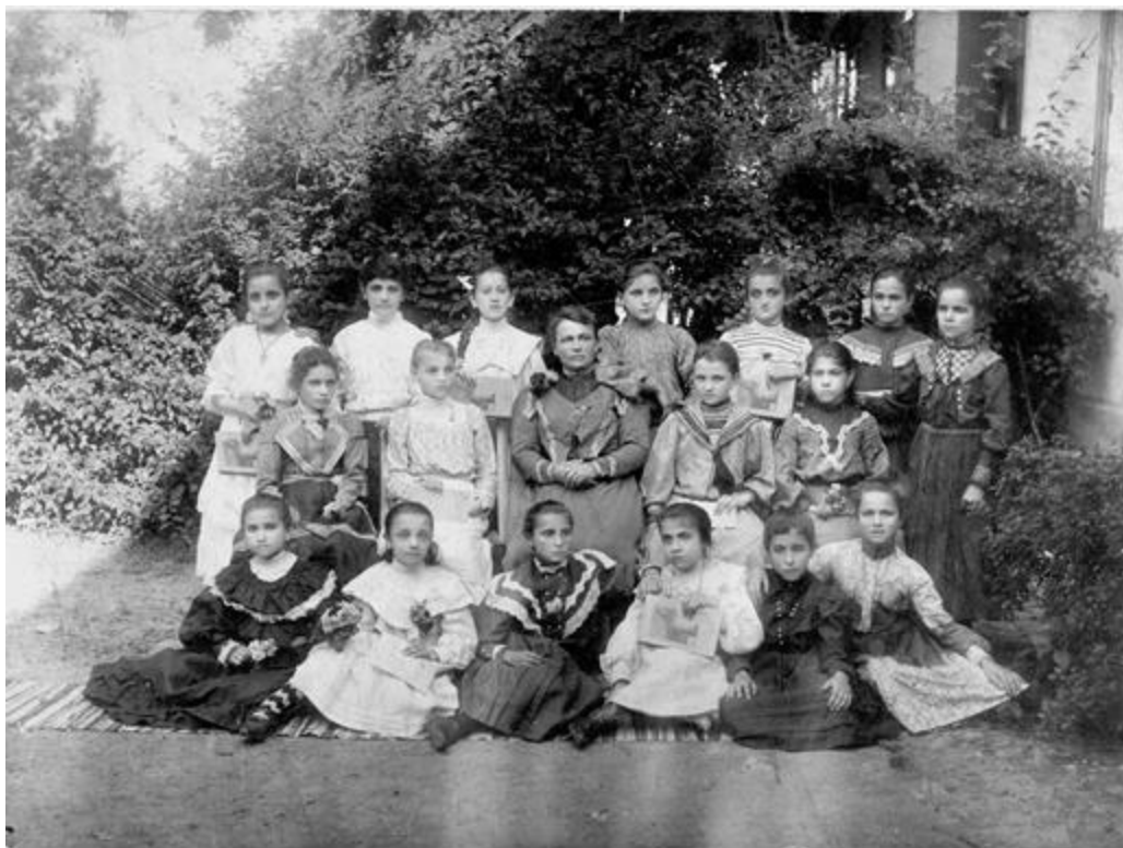
Ученице гимназије око 1910. године

Што се тиче нижег течајног испита, констатовао сам да су сви испити текли правилно а да су ученице показале довољно успеха а особито из српског и немачког језика. Из математике био би много бољи успех да наставник није дуже одсуствовао због болести.